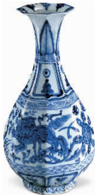
元青花双狮戏球纹八棱玉壶春瓶 河北博物院藏

本报讯 亚洲古代文明绚丽多彩,篇章恢弘,博大精深,各美其美。近日,河北博物院讲述“世界故事”之“同在东方——亚洲古代文明展”亮相该院北区13、14号展厅,共展出极富亚洲历史文化特色的珍贵文物190余件套。此次展览旨在为观众进一步解读与中华文明共生于亚细亚大陆的两河文明、印度河文明等古老文明,从而深入了解亚洲古代各文明之间以及与欧洲古代文明之间的交流互鉴,从不同角度感受亚洲文化地缘相近、文化相亲,而不同、和平相处的特质。