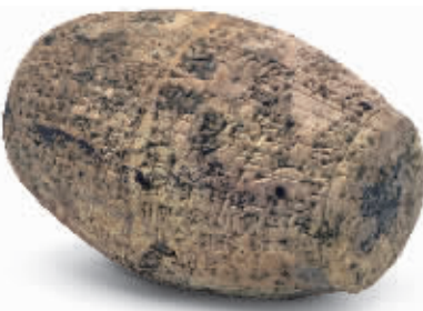
约公元前19世纪楔形文字圆筒形碑文 日本平山郁夫丝绸之路美术馆藏