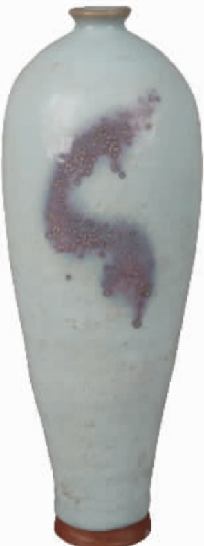
宋钧窑天蓝釉红斑梅瓶 河北博物院藏

藏的约公元7世纪石雕蛇王纳迦护佛像,日本平山郁夫丝绸之路美术馆收藏的约公元前19世纪楔形文字的圆筒形碑文,以及我国河北博物院收藏的唐鎏金鹿纹菱花形银盘、宋钧窑天蓝釉红斑梅瓶、西汉“当户”铜灯、十六国铜鎏金带华盖禅定坐佛三尊像等。据悉,此次展览将持续到2月28日。 (记者 王国良 通讯员 张永强)