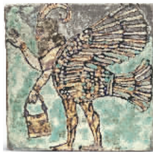
约公元前8世纪釉面砖 日本平山郁夫丝绸之路美术馆藏