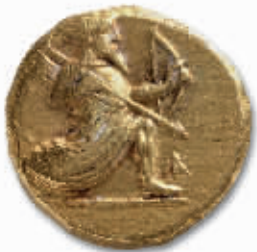
约公元前5世纪末—前4世纪初波斯金币,日本平山郁夫丝绸之路美术馆藏