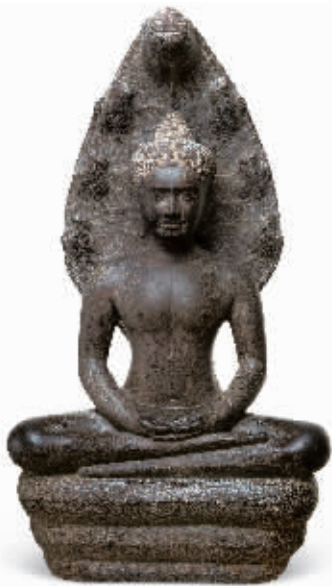
约公元7世纪石雕蛇王纳迦护佛像 柬埔寨国家博物馆藏