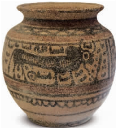
约公元前2700—前2400年彩绘陶罐 巴基斯坦考古与博物馆司藏