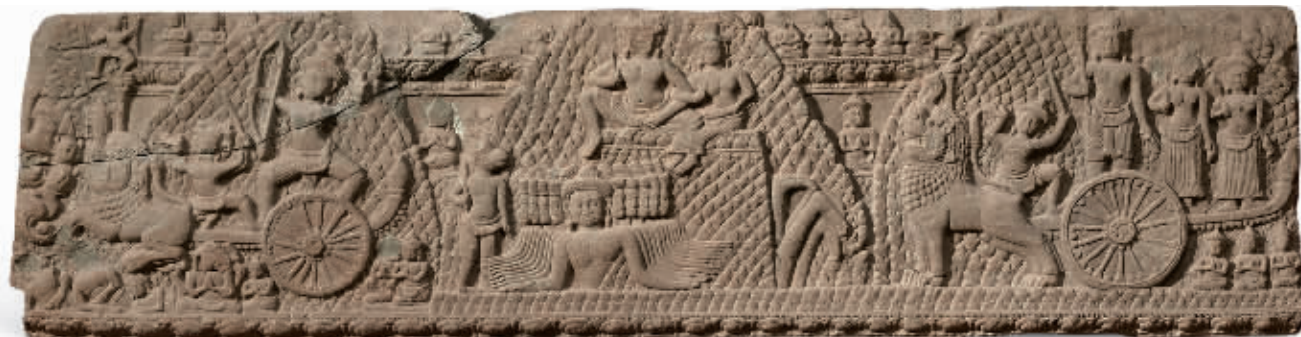
约公元10世纪石浮雕门楣,柬埔寨国家博物馆藏