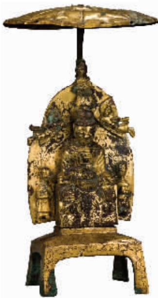
十六国铜鎏金带华盖禅定坐佛三尊像 河北博物院藏

如展出的一件由黎巴嫩文物局提供的罗马时期千花玻璃碗,十分吸引眼球。资料显示,千花玻璃特指古埃及人发明的玻璃制作技术,该技术在古罗