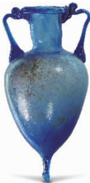
罗马时期蓝色玻璃迷你双耳瓶 黎巴嫩文物局藏