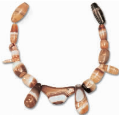
约公元1世纪瑪瑙挂饰,阿联酋 乌姆盖温国家博物馆藏