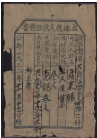
图3 因工人失业免税证