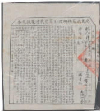
图1 万载县苏维埃政府农业累进征收券

除了马克思、列宁头像以外,苏区票证中体现中国共产党主张的较多,如米票(图5)。中华苏维埃共和国成立以后,为方便出差的红军战士和政府