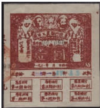
图4 闽西工农银行股票