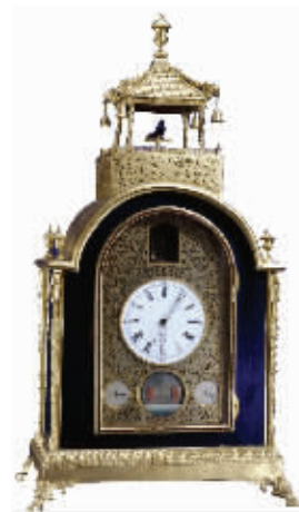
紫禁城里的清光绪苏州制钟

这幅画具有南宋画家马和之的笔意,不仅保存了前人的技法遗意,同时又抒发了个人的艺术特色,因此对文物的保护和传统技法的研究,就富有意义了。