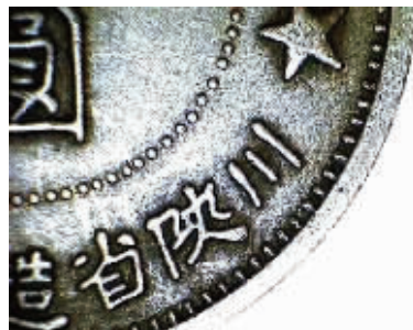
图2 川陕苏维埃银元假币的放大图，币面有均匀的喷绘点

其次说一下“压制”环节。从清末到民国正规造币厂铸造的机制银元，都是采用压力达上千吨的老式柱式机器压制，而造假者不可能投入较大的财力去定制这种淘汰设备，其铸制的方式有三种：冲床、气压冲压机、柱式液压机。由于使用的机器不同，仿制银元基本上有两种特征，一是因机器压力不足，致使高仿银元容易呈现底板不平整、图纹不深峻、图案发虚等现象。二是机器压