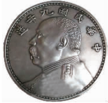
图5 纯银高仿液压深打

力过重，致使高仿银元现出底板“雕模”痕迹(喷绘点)，文字、图纹深峻，图案的清晰度太过分等现象。(图3、4、5)