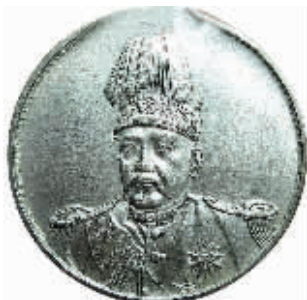
图3 激光雕模重打高仿银元