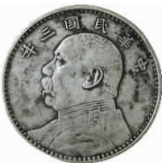
图8 纯银高仿袁大头

三要克制好捡漏心态。不要有自以为是的任性心态，“人外有人天外有天”是古训，在当今的古老钱币市场上，少见高手多见高仿，是没有“漏捡”的买卖。