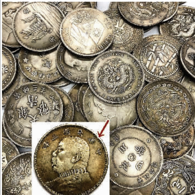
图1 涉案纯银高仿袁大头(部分)