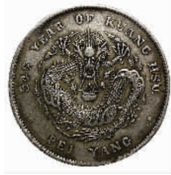
图4 机雕手修模重打高仿银元