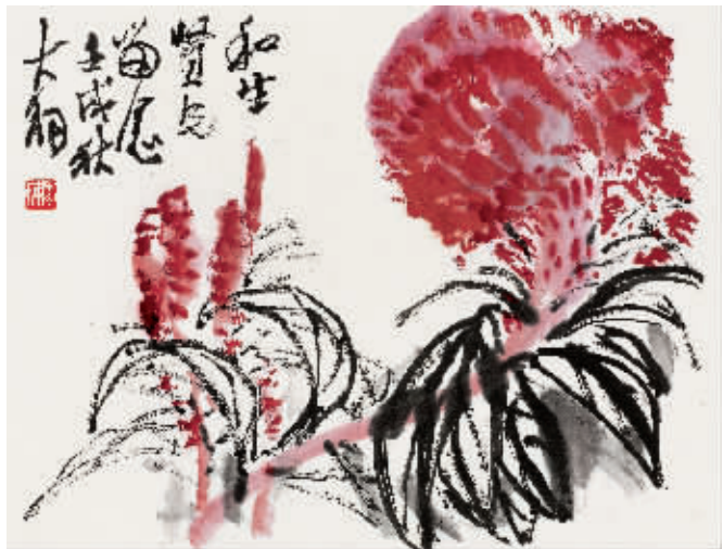
图1 陈大羽作《鸡冠花》