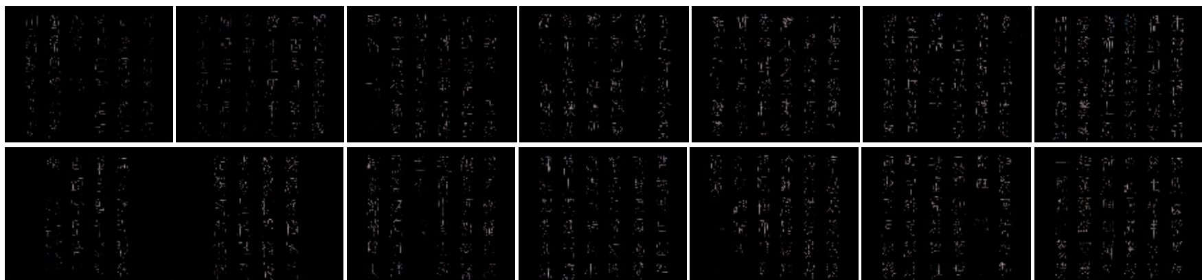
明许初篆书《杜甫秋兴八首》