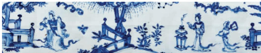
图2 青花罐腹部画面展开图

再赏罐体画面：以通景取景，月色笼罩下，妇人于案前焚香，眉目温婉，优雅婀娜。其后侍女持扇静候，云气缭绕，亭台掩映，衬以升起袅袅白烟的香炉，引人入胜——一代绝世美颜貂蝉的遭遇固然令人惋惜，然而在那一时代背景下，貂蝉的命运抉择却又不知感动了多少后来人。