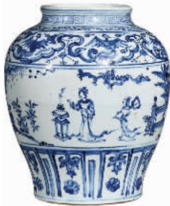
图1 明代青花貂蝉拜月图罐