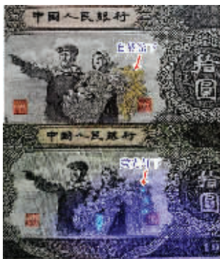
图8 仿品在自然光和荧光灯下