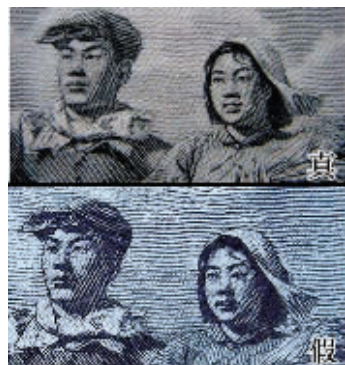
图7 强光下的色基和底纹等真伪对比