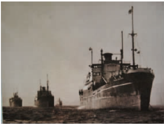
招商局海辽轮起义

收藏品市场上,根据两版纸分币冠号数字的不同通常称53初版纸分币为长号纸分币,称80年代再版的纸分币为短号或无号纸分币。最初53版长号纸分币因当时的社会经济条件被大量使用消耗,流通长达数十年,如今早已难以寻觅,又因其是初版币,具有很高的历史价值与收藏价值。后期再版的无号纸分币上世纪80年代发行量巨大,后因90年代初我国经济发展迅速,小面额纸币实际使用量不多,新世纪后逐渐退出市场流通。