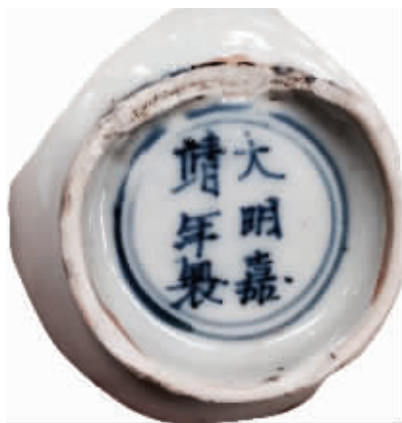
图2 清仿嘉靖款瓷碗外底

卢员外在梁朝为官。一日,梁武帝闻报水西门外卢家庄园牡丹花开,便着便服来员外家赏花,梁武帝偶然见到莫愁花容月貌,不由神魂颠倒。回宫后,寝食难安,终于想出一个毒计,害死了卢公