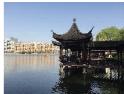
图3 南京莫愁湖回廊与待渡亭

《瓷艺》一书说,明代嘉靖瓷器的青花,多以蓝中泛紫为主。除以色泽取胜外,造型、品种更加多样,多为文具、餐具、盘碗。除青花外,五彩瓷喜用红、黄、绿、赭重色和鲜亮的孔雀绿彩,绘以纹饰,华缛绚丽,风貌清新。青花五彩的制作也是自嘉靖朝开始发展的。还有斗彩是以仿成化器为宗,有高士杯、耍钱杯等。单色釉仿烧龙泉的东青釉、霁蓝、回青釉及低温的茄皮蓝、孔雀绿、瓜皮绿诸色,釉色明艳晶莹,都很成功。这个时期的款识为“大明嘉靖年制”六字,楷书,刚柔相济,用笔流畅。民窑大多是仿前朝的东西,也是如此跟进的,当然民窑工匠写的精准性无法与官窑同语。这块瓷片可謂是民窑“清仿明”之标本。