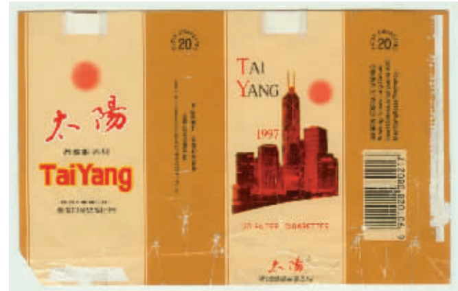
图6 河北张家口卷烟厂出品于上世纪90年代的太阳香港回归纪念烟标