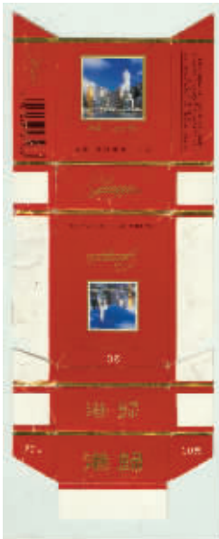
图7 安徽亳州卷烟厂出品于上世纪90年代的港归烟标