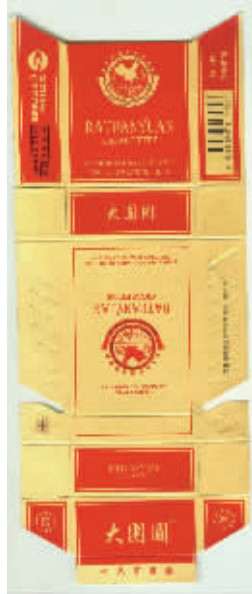
图9 颐中集团青岛卷烟厂出品于上世纪90年代的十枚套大团圆烟标·普天贺团圆