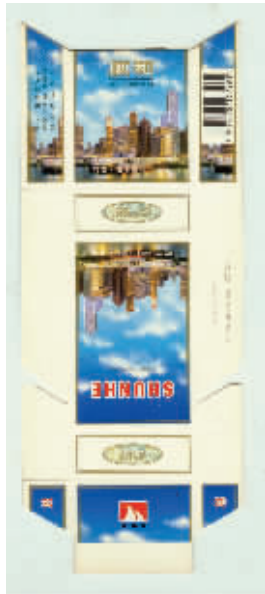
图8 河南南阳卷烟厂出品于上世纪90年代的顺和香港回归纪念烟标