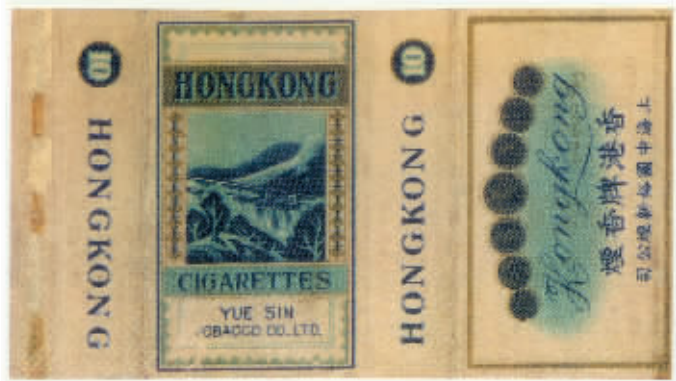
图1 上海中国裕新烟公司出品于上世纪30年代的香港烟标