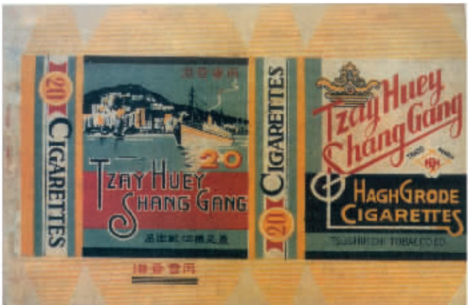
图3 最是烟厂出品于上世纪40年代的再会香港烟标