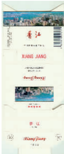
图5 中国四川卷烟厂出品于上世纪90年代的香江烟标