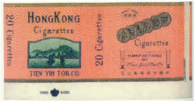
图2 中国天益烟厂出品于上世纪40年代的香港烟标