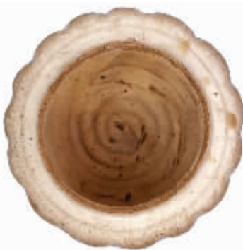
图2 唐白釉瓜棱钵内部