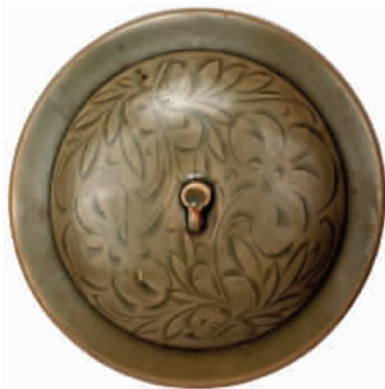
图5 宋带盖青瓷碗碗盖