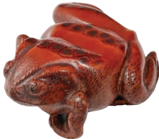
18世纪竹根雕蛙,王世襄旧藏(香港佳士得2020线上拍卖“赏心乐艺”专场212.5万港元落槌)

编者按:7月15日晚,在香港佳士得线上拍卖专场“赏心乐艺”中,一只18世纪竹根雕蛙以212.5万港元落槌,远超其最高估价60万港元。由此,这件长度仅为7厘米、只有巴掌大小的竹蛙,被古玩圈戏称为“史上最贵蛤蟆”。这只竹根雕蛙为何能拍出如此高价?原来,它是“京城第一玩家”王世襄旧藏:双目圆睁,四爪收紧,作蓄势待发状态,仿佛下一秒就要向前跃起,十分生动形象。王世襄曾于《竹刻鉴赏》书中称赞此蛙曰:“余见竹根蟾蜍多矣,未有胜于此蛙者。”足见老先生对其的喜爱程度。除了竹雕,王世襄还以收藏铜炉闻名天下——