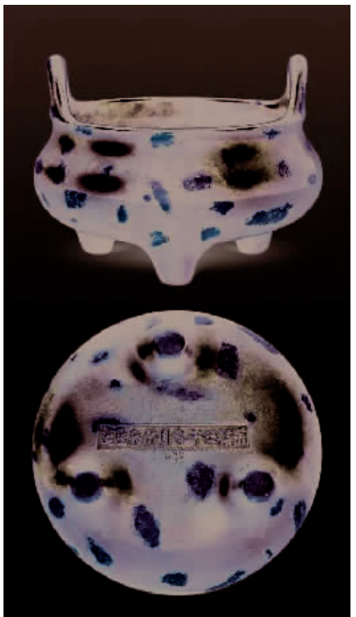
明“崇祯壬午冬月青来监造”楷书款冲天耳金片三足炉(2003嘉德秋拍“俚松居长物志”专场成交价166.1万元,2010匡时秋拍“锦灰吉金”专场成交价1512万元)