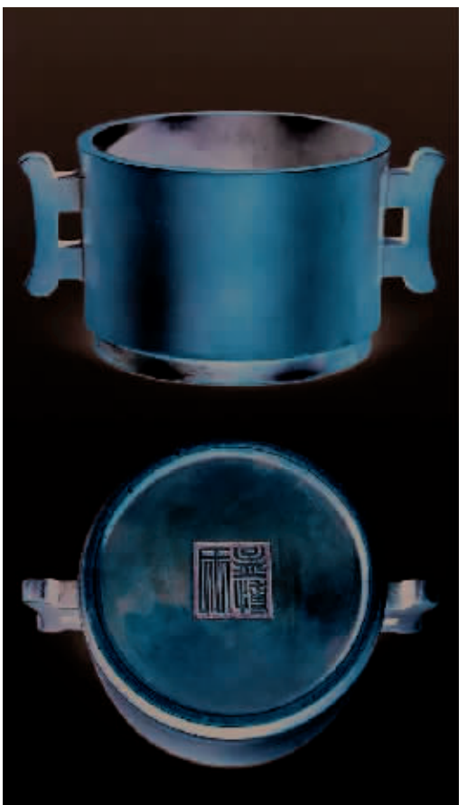
明末“孟博氏”篆书款戟耳炉(2003嘉德秋拍“俚松居长物志”专场成交价56.1万元,2010匡时秋拍“锦灰吉金”专场成交价582.4万元)