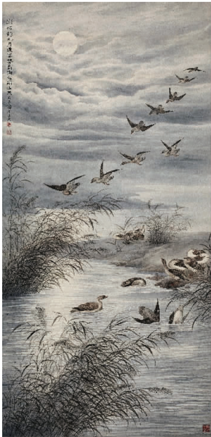
《池塘芦雁图》，成交价575万元

步入21世纪后，陶冷月的作品很受市场的欢迎，价格扶摇直上，迭创佳绩。2004年《平湖夜月》(1932年作)在苏富比受到众多买家追捧，最后以222.38万元拍出，高出估价11倍；2005年《松泉月景》成扇在上海天衡获价35.2万元；同年，《月塞芦雁》被保利上海拍至176万元，此作2012年再次被中国嘉德推出，获价575万元，7年价格翻了3倍多；2006年《山水》成扇在北京匡时国际获价31.36万元，2014年《十全富春》