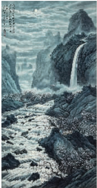
《桃源夜月》，成交价448.5万元