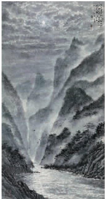
《寒江月夜》，成交价241.5万元