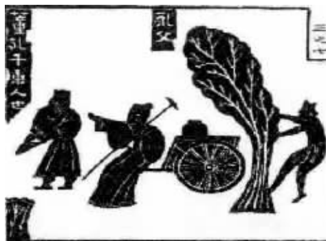
图6 武梁祠中董永故事的画像