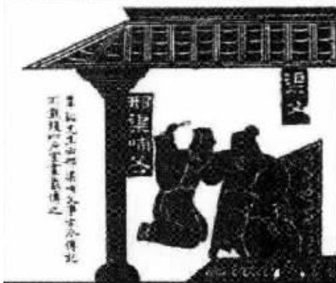
图2 武梁祠中的邢渠哺父图