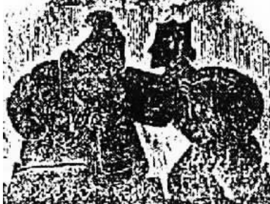
图3 武氏祠左右石室的邢渠孝行图