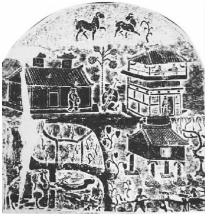
图7 四川成都曾家包东汉墓出土的天府殷实图