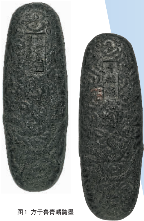
图1 方于鲁青麟髓墨