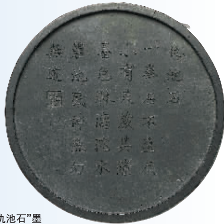
图4 方于鲁“仇池石”墨

方于鲁，安徽歙县人，明代万历年间的制墨名家，与同时代的制墨家程君房齐名。方于鲁所制之墨，享有很高的声誉，其所制的髹彩墨更是前无古人。台北故宫博物院藏有落款方于鲁的墨品多件，在此择其部分作品予以介绍。