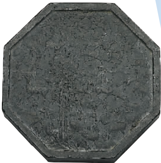
图2 方于鲁百骏图八角墨