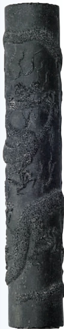
图5 方于鲁龙纹柱形墨