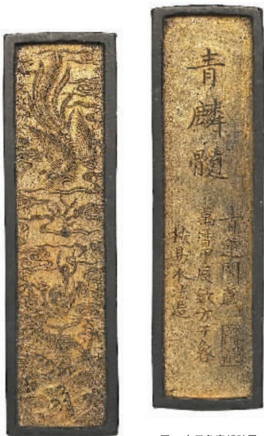
图3 方于鲁青麟髓墨