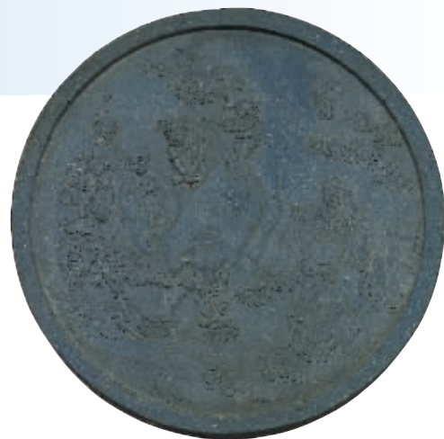
图7 方于鲁监制圆形青墨