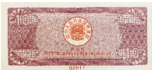
图3 1991年拾圆国库券，紫色，正面主图“云南石林”，尺寸142×64毫米