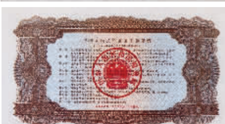
图10 1981年壹万圆国库券，棕色，正面主图“官厅水库”，尺寸180×100毫米