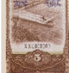
图2 1984年伍圆国库券，棕色，正面主图“飞机喷洒农药”，尺寸64×142毫米