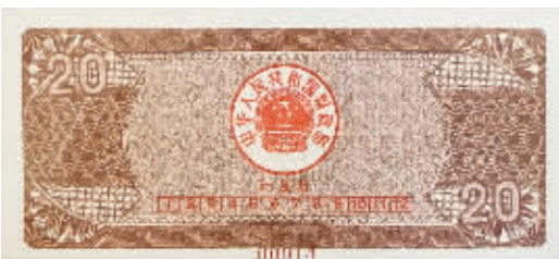
图4 1991年贰拾圆国库券，棕色，正面主图案“贵州黄果树瀑布”，尺寸142×64毫米