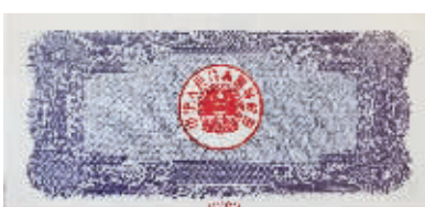
图5 1986年伍拾圆国库券，蓝色，正面主图“农业联合收割机”，尺寸156×72毫米