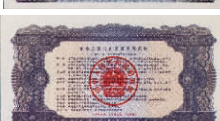
图11 1981年拾万圆国库券，深蓝色，正面主图“官厅水库”，尺寸180×100毫米