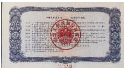
图1 1982年壹圆国库券，蓝色，正面主图“露天煤矿”，尺寸140×75毫米