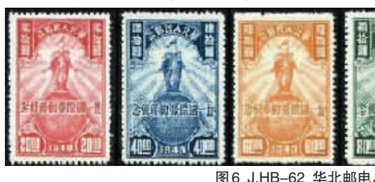
图6 J.HB-62 华北邮电总局五一国际劳动节纪念邮票

1948年5月1日,东北邮电管理总局发行了1套3枚的“五一国际劳动节”纪念邮票(J.DB-53,图4),采用了同图异色印刷,面值分别是50元(红色),150元(绿色),250元(紫色)。主画面上是一只光芒四射的巨大地球,一面书写着“全世界无产者联合起来”的旗帜迎风飘扬。