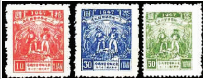
图3 J.DB-39 东北邮电管理总局五一世界劳动节纪念邮票