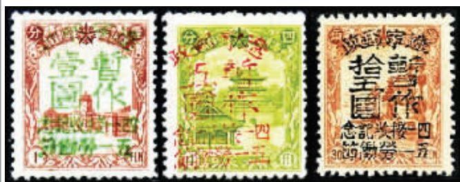
图1 J.DB-70 四一接收纪念五一劳动节邮票