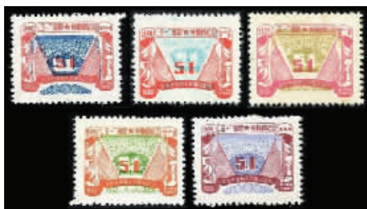
图5 J.DB-64 东北邮电管理总局五一劳动节纪念邮票

解放区正式发行的第一套劳动节主题邮票是“五一世界劳动节纪念”邮票(J.DB-39,图3),发行时间1947年5月1日,发行部门东北邮电管理总局。这套邮票画面取材自著名漫画家华君武的画作,构图简洁,线条流畅。全套3枚,面值为10元(东北币,红色)、30元(蓝