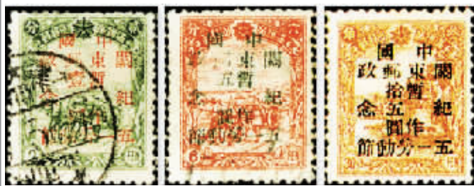
图2 J.DB-76 关东邮电总局纪念五一劳动节邮票