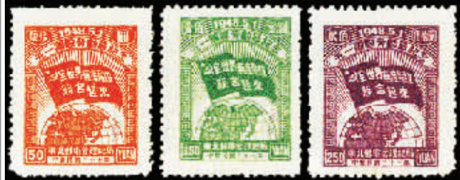
图4 J.DB-53 东北邮电管理总局五一国际劳动节纪念邮票