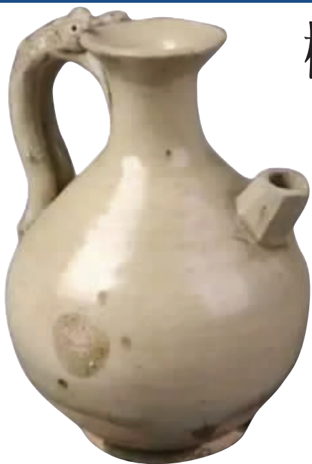
图1 隋代青釉蛇柄执壶