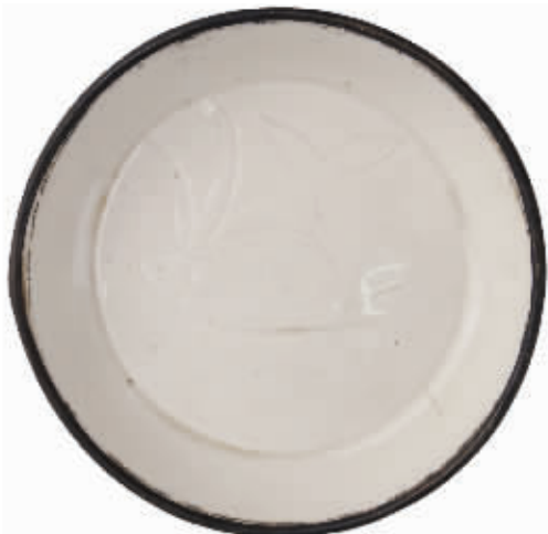
图1 宋代定窑白釉刻花鱼纹盘

定窑因窑址在宋代属定州而得名,窑址具体位于今天河北省曲阳县涧磁村及东西燕川村。定窑瓷器创烧于唐代,盛于宋、金时期,止于元代。北宋时定窑曾一度烧制宫廷和官府用的精致瓷器,故民国时期许之衡《饮流斋说瓷》中谈到:“宋最有名之有五,所谓柴、汝、官、哥、定是