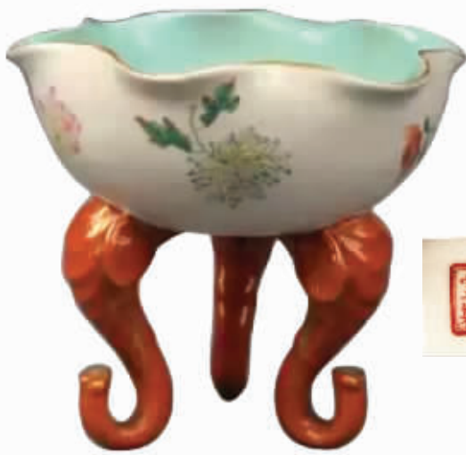
图3 清乾隆轧道粉彩花卉荷叶式炉

德镇窑烧造。口径13.5×6.4厘米,高8.2厘米。造型美观别致,形似青铜匜,敞口,三灵芝状足,口外一侧有青花装饰兽形单耳柄。内里施松石绿釉,外壁以酱红釉为地,自口沿至底部描金绘饰波浪纹、圆点纹、花卉纹。