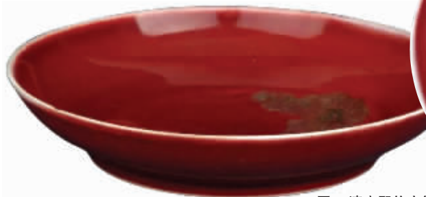
图4 清康熙仿宣德红瓷盘

图4,清康熙仿宣德红瓷盘。1980年3月单县黄岗公社赵楼村收购,现藏单县博物馆。高4.2、口径21.5、底径13.9厘米。重0.4千克。仿宣德红