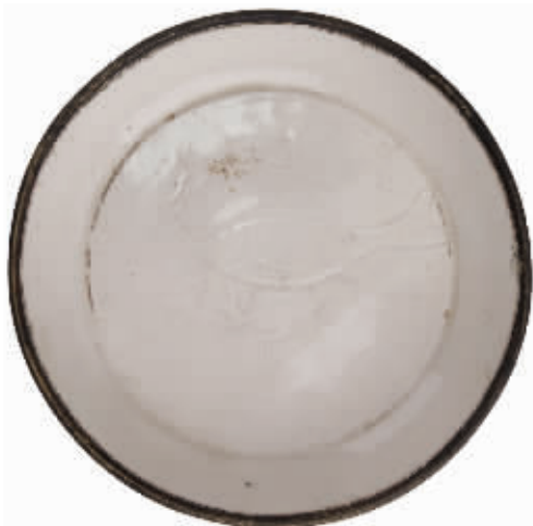
图2 宋代定窑白釉刻花鱼纹盘