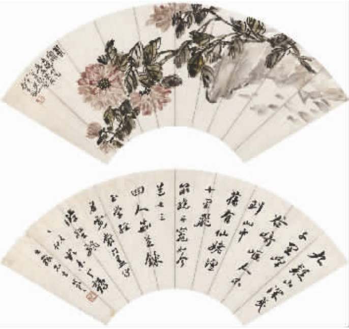
吴昌硕、张謇合作《花开富贵图·行书唐诗(二帧)》扇页,设色纸本

当今社会,博物馆肩负着促进不同文化交流互鉴的重要职责,在展示中华文明魅力、传播世界文明成果方面发挥着重要的窗口作用,理应在坚定中国特色社会主义文化自信上走在前列。南通博物苑作为中国入自办的第一座公共博物馆应承担在构建中华文化传承体系中的使命,而越窑青瓷皮囊式壶作为“镇苑之宝”,让我们感受到中国文化海纳百川的博大胸怀,相信这份文化自信也必将焕发出无比强大的活力。