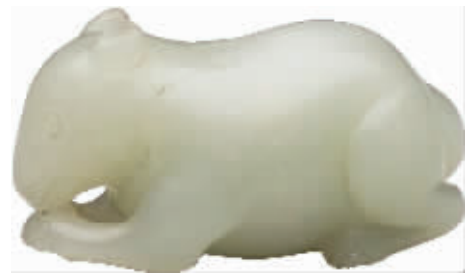
图4 清代青玉鼠,台北故宫博物院藏

台北故宫博物院也珍藏有一件“清代青玉鼠”(图4),其全高3、长5.86厘米。整件肖鼠形立雕技法而就,带长尾,前足相拢,蹲卧于地,表情稚趣、天真可爱。上佳青玉为质,凝若膏脂,呈色温润。此器简约质朴,刻工老熟,寥寥几刀,神形兼备,栩栩如生。在藏传佛教经文之中,财神的造像即手捧一只财宝鼠,故此“清代青玉鼠”象征着辈辈有数不尽的财富、数不尽的荣华富贵。