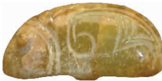
图2 西周青玉鼠,三门峡市虢国博物馆藏

现收藏于三门峡市虢国博物馆的青玉“西周玉鼠”(图2),也是历代玉鼠雕件中的少见之品。其长2.6、宽0.9、高1.2厘米。豆青色,大部受沁呈黄褐色。玉质较粗,微透明。玉鼠伏卧状,背部拱起,曲爪附地,圆眼微凸,阴线刻出头、足、短