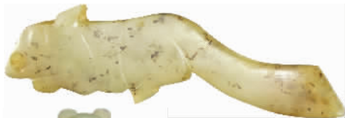
图1 商晚期白玉殷商玉十二生肖子鼠, 安阳殷畿艺术博物馆藏