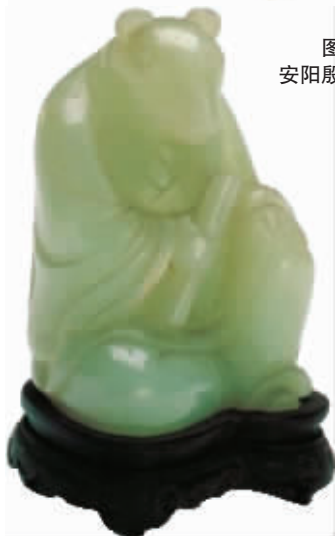
图3 清代青玉十二生肖子鼠, 北京故宫博物院藏