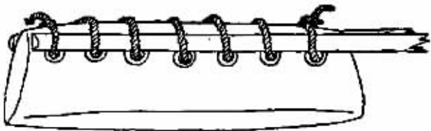
图2 多孔石刀装柄示意图