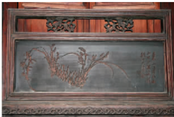
胡适故居里的兰花饰板

大师。胡国宾比胡适的父亲胡铁花(1841—1895)小7岁，其徽墨墨模雕刻的代表作，就是他65岁那年费尽一年多时间日夜雕刻而成的、曾获1915年巴拿马世博会金奖的《地球墨》徽墨墨模经典；而其徽州木雕艺术的代表作，就是这胡适故居里的兰花草系列木雕饰板。现在，“徽墨制作技艺”和“徽州三雕制作技艺”，均已成为首批“国