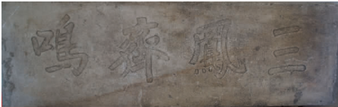
清雍正帝御书《三凤齐鸣》匾