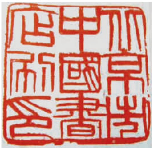
中国书店上世纪70年代末至90年代初使用印章:北京市中国书店刷印