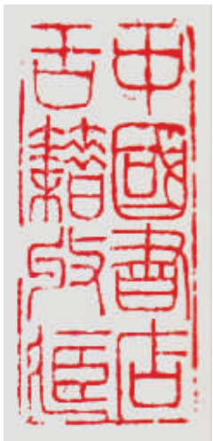
中国书店上世纪50年代末至70年代初使用印章:中国书店古籍收藏