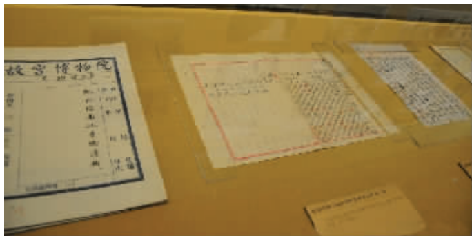
故宫文物南迁史料

馆举行。对抗战时期故宫文物南迁所涉及的相关档案、历史照片、实物等进行展览展示,重