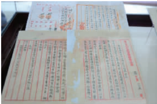
当年国立北平故宫博物院写给地方政府的公函