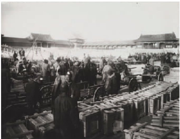
1933年3月28日第三批古物南迁前文物箱装车情景

本次展览是纪念故宫文物南迁乐山80周年活动的内容之一,是乐山市用心守护传承中华文化,擦亮乐山城市文化名片,建设世界重要旅游目的地的具体行动。(宋豪新)