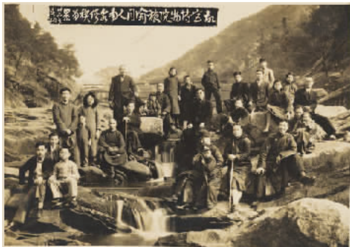
1936年故宫南迁人及家属在重庆合影