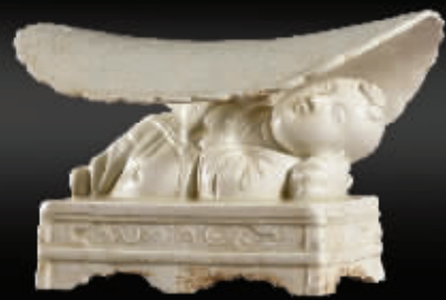
北宋至金定窑白釉孩儿枕

刊号CN-35(Q)第0078号 国内邮发代号33-52 逢周三出版 福建日报报业集团主管 石狮日报社主办 总编辑:茅罗平