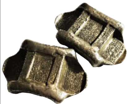
图2 云南呈马鞍形的牌坊锭