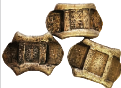
图4 丽江所见三枚“公估”牌坊锭