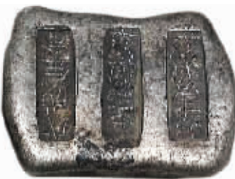
图7 云南发现的束腰形5两小银锭