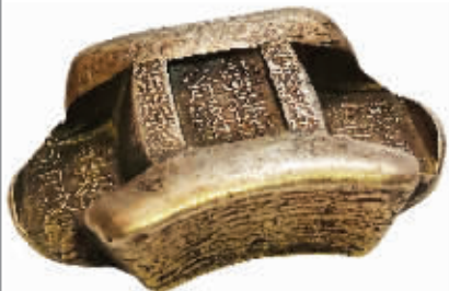
图3 丽江所见“玖月纹银”牌坊锭