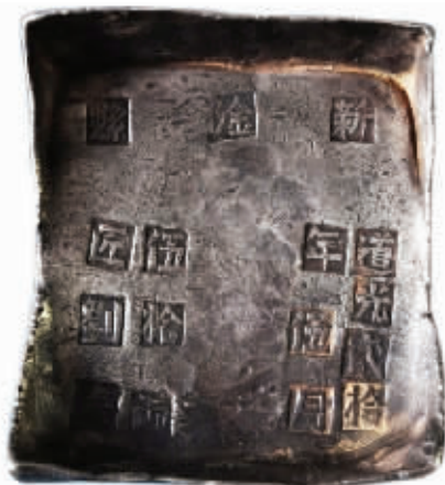
图5 江西省铸50两方斗形大银锭

另有3种“公估”牌坊锭(图4)，以一两37克计。其一为铭“光绪捌年，丰茂纹银，公估童看讫”纪年锭，重4.6两。其二为铭“腊月纹银，雷庆泰号，公估童看讫”纪月锭，重4.5两。其三为“正月纹银，陈元昌号，官公估余陈看讫”纪月锭，重4.8两。以4.95两的“玖月纹银”纪月锭为例，铭文中的“玖月”为月份，“万丰