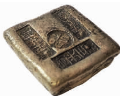
图6 云南遇到的5两方斗形小银锭

徐记”是票号，“公议纹银看讫”即鉴定。其他牌坊锭如此类推，只是此后“公议”换成了“公估”或是“官公估”，都须三者俱全。