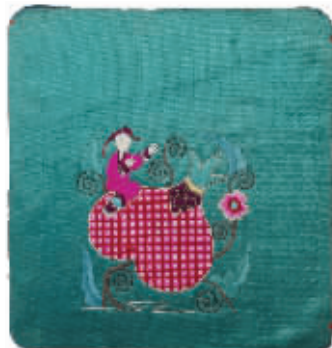
图3 绣品上的“孩童骑石榴”