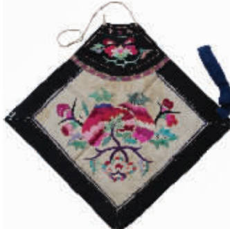
图5 石榴花纹绣花肚兜