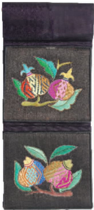
图1 石榴花纹的褙褙荷包