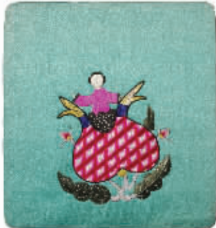
图4 绣品上孩童从石榴中穿出