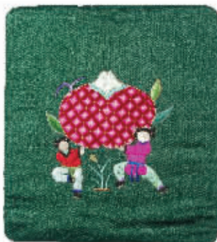
图2 绣品上的“两孩童举石榴”

周围百姓见此状非常惊讶,询问情况,方知为长者送石榴生子。花匠就在花园里种植石榴,精耕细作,定时浇水、精心培育,功夫不负有心人,春天