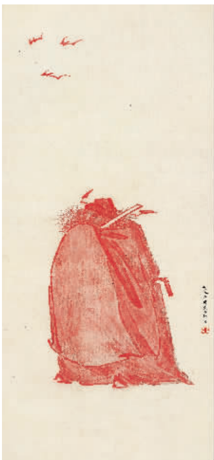
林散之《钟馗图》(1940年夏)