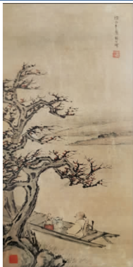
林散之1924年绘人物四条屏,从左至右依次为:仿任伯年笔意、仿方兰坻笔意、仿展子虔笔意、仿王小梅笔意