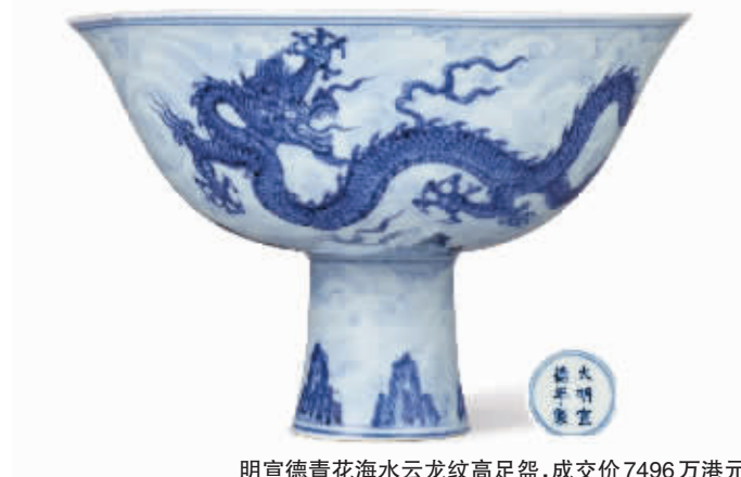
明宣德青花海水云龙纹高足盘, 成交价 7496 万港元