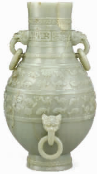
清乾隆和阗青玉兽首衔环鳃鱼壶 成交价 2172 万港元

隆铜鎏金嵌百宝福寿香熏也受到追捧, 以 671 万元成交。在北京海王村书拍会上, 手札尺牍也十分抢手, 一件《汪精卫、陈公博、蔡元培、于右任、章士钊等人致何焯贤信札及书法》一组, 底价 20 万元, 竟被拍至 43 万元。此外, 在翰海秋拍会上, 除了字画火爆外, 玉器也创佳绩, 成交价突破百万元的有 12 件之多, 其中, 清乾隆白玉坐佛被拍至 495 万元, 清玉衔芝瑞兽 (十件) 被拍至 330 万元; 清乾隆白玉游环香炉被拍至 307 万元。