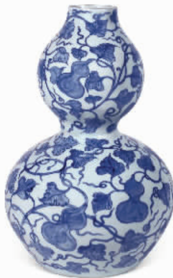
元青花缠枝福祿万代大葫芦瓶 成交价 5681 万元

到 2004 年, 国内的艺术品拍卖更为火爆, 其中, 中国嘉德 14 个专场总成交突破 4.8 亿元, 单件成交价超过百万元的拍品达到 70 余件, 而超过千万元的作品就有两件, 分别是 1265 万元成交的清王鉴《仿古山水》册页和 1870 万元成交的傅抱石《云中君大司命》。另外, 还有 6 件作品超过 500 万元。值得一提的是, 清恽寿平作品近几年屡创佳绩, 本次《花卉》册页以 693 万元成交, 郑板桥的《竹石兰蕙图》以 539 万元成交, 并创郑板桥绘画作品新高, 八大山人的《鱼》仅 0.6 平方米, 但因此作原为张大千收藏, 画上盖有大风堂收藏印, 故此作受到了各路买家热烈追捧, 以 484 万元成交。而在翰海秋拍会上, 拍前被藏家普遍看好的清初黄花梨雕云龙纹四件柜, 上拍时受到各路买家的热烈追捧, 最后以 1100 万元的天价, 创国内家具拍卖成交新纪录。海外回流的圆明园遗珍银铺首和清乾隆铜鎏金嵌百宝福寿香熏也是翰海拍卖各位引人注目的精品。银铺首是 150 万元的起拍价登场, 不一会就被买家叫至 280 万元, 结果, 此件作品在 380 万元的价格上一槌定音, 若加上佣金, 合计 418 万元; 另一件清乾