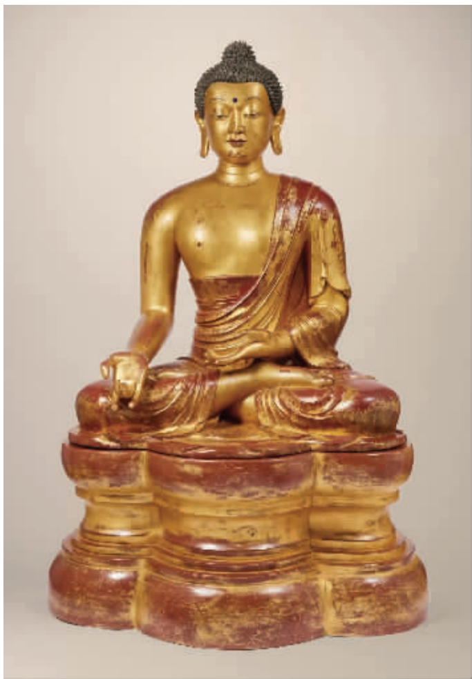
清 18 世纪御制木胎漆金药师佛坐像, 成交价 3132.5 万港元

德拍卖时以 440 万元成交, 而此次该瓶在香港苏富比以无底价推出, 结果各路买家你争我夺, 互不相让, 最后被一买家以 1518.24 万港元收入囊中。在同场拍卖会上, 另一件清雍正“粉彩过墙枝蟠桃纹大盘”以 1294.2 万港元拍出。更令人惊讶的是, 清乾隆“胭脂红地轧道锦纹粉彩缠枝花卉纹梅瓶”以 4150.2 万港元的天价成交, 创当时清代瓷器的市场最高价。同样, 国内的顶级艺术品也受到热烈追捧。如 2001 年上海敬华首次拍卖会上, 一件明永乐“青花折枝花纹八烛台”十分亮眼, 该官窑无论是制作工艺, 还是造型和青花成色均显示出经典青花瓷器的本色。目前, 这种烛台在全世界数量很少, 所以该烛台上拍后受到了藏家的热烈追捧, 最后以 968 万元拍出。此外, 清“田黄雕佛手章料”以 165 万元成交; 明陈洪绘的《举案齐眉图》以 308 万元被人收购; 清任伯年的《无量寿佛》以 123.2 万元成交。