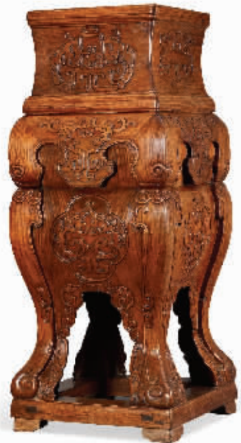
明黄花梨螭龙纹大方台, 成交价 2587.5 万元

所有这些均显示了艺术精品极受藏家的青睐和追捧。目前, 市场上无论是什么品种, 只要该件艺术品属于最好的、顶级的, 藏家一般就肯掏钱, 有的甚至不惜巨资予以收购, 这或许是顶级艺术品价格难以下跌的原因吧。