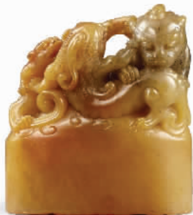
清乾隆御制田黄三螭钮宝玺, 3012 万港元成交

成交, 创当时中国漆器拍卖史最高成交世界纪录; 一幅张大千巅峰时期的泼彩山水《松峰映霭图》以 521 万港元高价落槌; 一条四十二颗配以重 10.45 克拉钻石在吊胆扣环的翡翠珠链以 1600 万港元高价被一位亚洲私人买家通过电话竞得。至于官窑瓷器始终是海外市场上的抢手货。如近十年来, 清雍正“青花釉里红海水云龙纹地球瓶”多次在拍卖场上亮相, 记得上世纪 90 年代中期在中国嘉