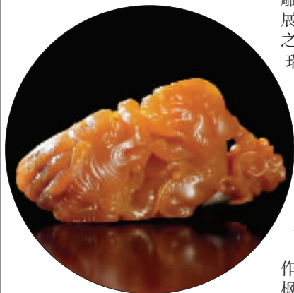
冯志杰 田黄石 滚狮把玩件