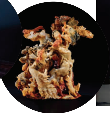
林亨云 高山石 百鸟争鸣摆件