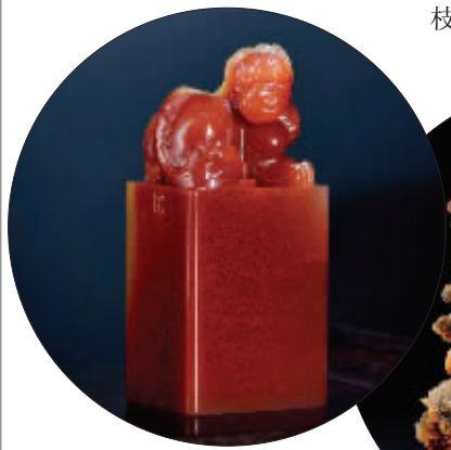
潘惊石 高山桃花冻石 瑞兽钮章