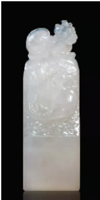
郭祥忍 冰糖地荔枝洞石 望子成龙方章