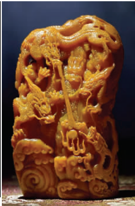
郭祥雄 田黄石 群龙献瑞随形章