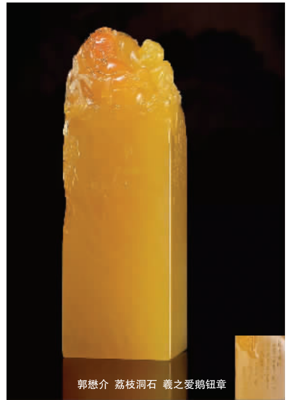
郭懋介 荔枝洞石 羲之爱鹅钮章