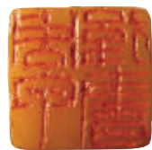
“周甲后书”白文印 浙江省博物馆藏