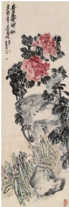
吴昌硕《贵寿神仙图》轴 西泠印社藏