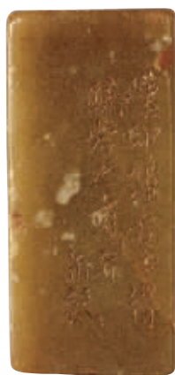
“壹月安东令”白文、 “染于苍”朱文双面印 浙江省博物馆藏