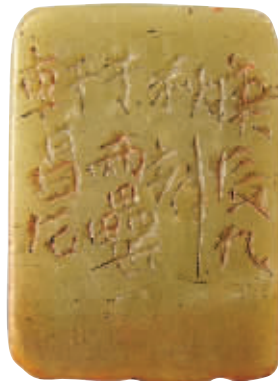
“俊卿印信”朱文印 浙江省博物馆藏