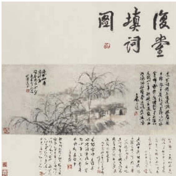
吴昌硕《谭复堂填词图》轴 浙江省博物馆藏

本报讯 记者从深圳博物馆获悉,一场汇聚了140余件艺术精品的“金石笔墨文人心——吴昌硕书画篆刻艺术展”,日前亮相深圳博物馆历史民俗馆。据悉,此次展览是十余年来集中度最高、规模最大的吴昌硕展览之一。