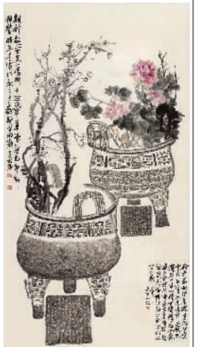
吴昌硕《鼎盛图》轴 浙江省博物馆藏

追求。其书法致力于商周大篆、两汉隶书,尤以石鼓文成就独领风骚。展览中展出的篆书施石墨句七言联、篆书集杜甫句七言联、行书诗翰轴、集《石鼓文》轴均是其书法精髓的绝佳见证。其中的集《石鼓文》轴,是吴昌硕83岁时为沙孟海所写,属其晚年力作。作品“临气不临形”,奇崛古拙,充满金石气息,是其晚年典型的书法面貌。