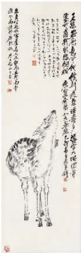
吴昌硕《临八大山人鹿图》 西泠印社藏