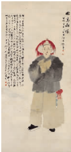
任颐《酸寒尉像图》轴 浙江省博物馆藏