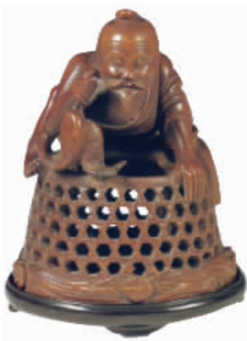
图2 明末清初竹根雕“渔翁得利”

北京故宫博物院藏有一件清代竹根雕骑象尊者(图1),高25、宽12.5厘米。其头向左倾,浓眉毛,双睛微合,颧骨突出,唇及两鬓长满胡须。袒胸,