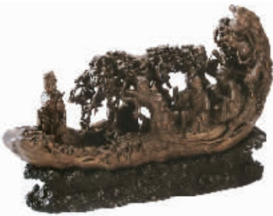
图3 清代竹根雕人物乘船

露出嶙峋瘦骨,双手相交于左膝上,左腿抬起,右腿下垂,足穿芒鞋,骑坐在大象身上。大象回首,四腿直立,四足下为盘曲缠绕之竹根。受禅宗“人人皆可修行成佛”主张的影响,尊者(也称罗汉、应真等)像大量出现。乾隆皇