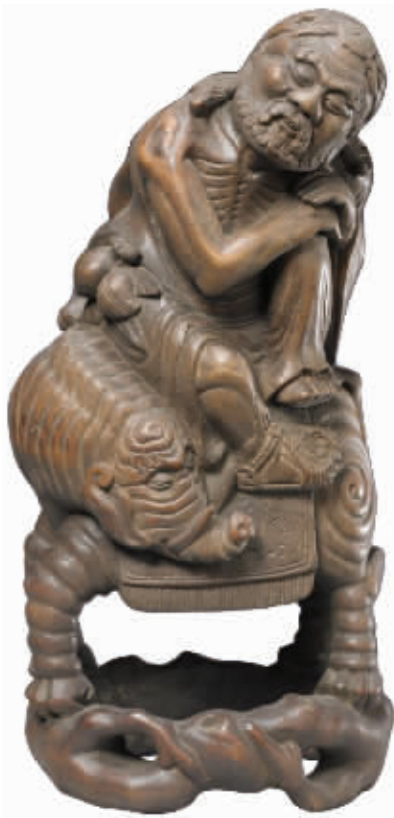
图1 清代竹根雕骑象尊者