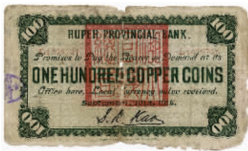
图2 湖北官钱局铜元一百枚背面