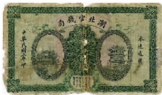
图1 湖北官钱局铜元一百枚正面