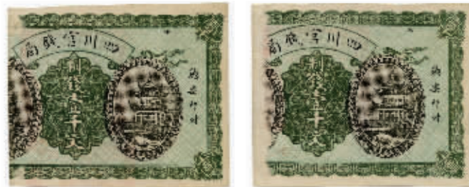
图3 两张四川官钱局制钱一千文(残币)正面

有趣的是这两省官钱局发行的纸币,初看其样式、图形结构、着墨等几乎雷同,细看才能发现区别。这可以看出两省官钱局之间的交往,对金融专家和钱币爱好者的研究提供了实物,这是可贵之处。