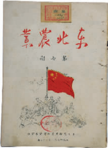
《东北农业》杂志封面

大,歌词最多,音节最长,而后者则篇幅最小,歌词最少,音节最短。“歌唱祖国一周年”歌词573字,音节164个,篇幅为4页码,“我爱我的枪”歌词40个字,音节11个,篇幅只占一页码的1/6。歌词写道“我爱我的枪/擦得光又亮/帮我练技术/消灭贼老蒋/嘎/拿起三八枪/跑步到操场/学习正规化/保卫边疆”。短短40字,唱出解放军战士“我爱我的枪”之主题,