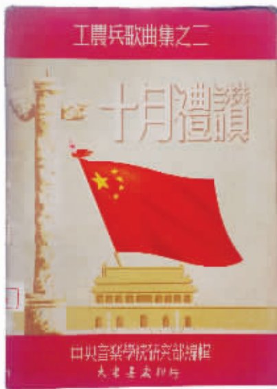
《十月礼赞》杂志封面

在这《十月礼赞》的歌集中,最值得提出的是“歌唱祖国一周年”和“我爱我的枪”两首歌曲,其特点为前者篇幅最