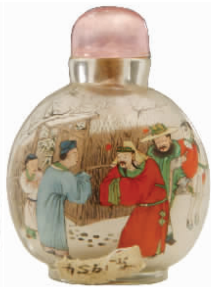
图4 水晶内画“三国人物”鼻烟壶