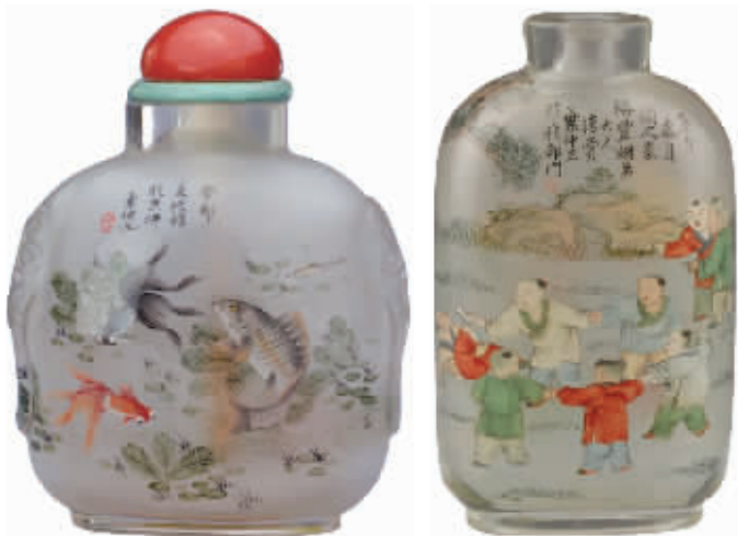
图1 玻璃内画鱼藻纹鼻烟壶

在艺术市场上,叶仲三的内画鼻烟壶很受欢迎。早在1985年,纽约苏富比举办的鼻烟壶专题拍卖中,一件“叶仲三玻璃内画严骑兵二等卒鼻烟壶”就估价7000美元。2012年,北京保利的一件“叶仲三内画人物故事诗文鼻烟壶”,则以人民币42.55万元拍卖成交。