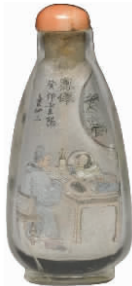
图3 水晶内绘人物鼻烟壶

银饰为清代帽饰,通高19厘米(含全部),重26.7克(含全部),银饰面高3.7、宽7厘米。五条银链长约13—14厘米不等,几乎就是普通帽饰银链长之翻倍。五枚花口喇叭形银铃坠,一大四小,大者高2.8、宽1.1厘米;小者各高约2、各宽约1.2厘米,内设银小铃铛,戴帽之人一旦走动,此帽饰银链银坠便会随之晃动,令小铃铛碰撞银铃坠,发出一阵叮当作响清脆悦耳银铃声,十分动听。银饰背面焊有长1.2、宽1厘米,上有“杨茂和”三字姓名款小银片。整件器物由模压、模鑿、鑿刻、锤揲、剪片、镂空、焊接、锉平、磨光等多道工序手工制作完成。