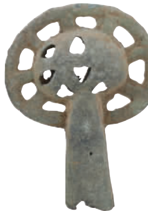
战国铜甬铃(一组) 湖北江陵砖瓦厂采集