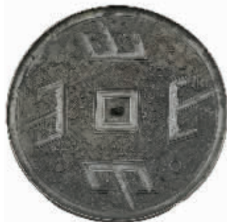
战国四山纹铜镜 荆州杨家山出土