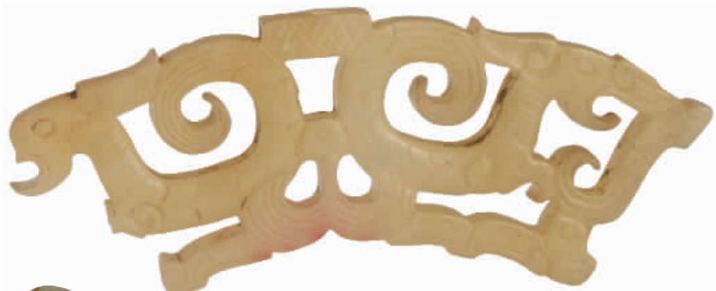
战国镂空龙螭珩 荆州秦家山出土