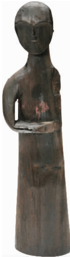
战国彩绘着衣俑 湖北江陵秦家嘴出土

该展览还展出了贴梳云鬓、楚人百态、华服丝绛、印宗秦汉、珍馐佳饌酒尽欢、静室怡人等共计22个小板块,介绍了绚丽多姿的荆楚文物,涉及衣、食、住、行、礼、侍、雅、美、文等各个方面,包罗万象,百态千姿,映照出两千多年前楚汉时期物质文明、精神文明以及蕴蓄其中的礼乐制度文明