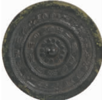
西汉双圈铭文铜镜 荆州鸡公山出土