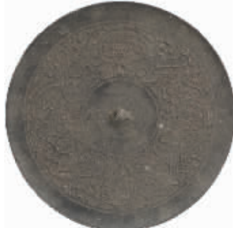
战国羽翅纹四兽纹铜镜 湖北江陵凤凰山出土