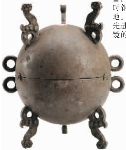
战国铜敦 湖北江陵刘家湾出土