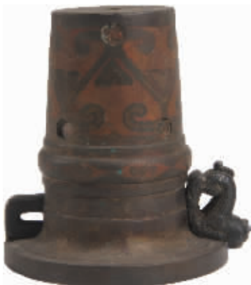
战国桃形云纹铜车軎 荆州沙市区喻家台出土