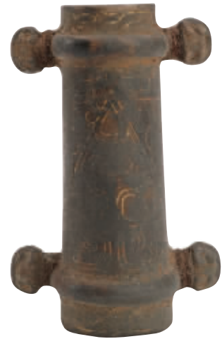
战国错金三角纹铜壁插 湖北江陵天星观出土

本报讯 近日,由镇江市文化广电和旅游局主办、荆州博物馆和镇江博物馆联合承办的“品物流芳——荆州古代精致生活文物展”在镇江博物馆专题展厅开展,共展出各类精品文物106件套。展期持续至11月30日。