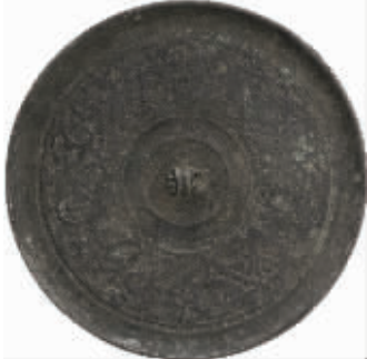
战国蟠螭菱纹铜镜 荆州高台出土