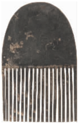
西汉木梳 荆州高台出土