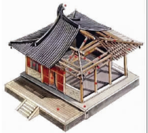
佛光寺东大殿解剖图(唐大中十一年,山西省五台县豆村镇)