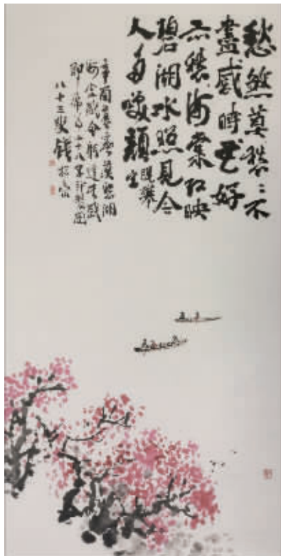
钱松岳《莫愁湖海棠红映图》(1981)

由此可见,钱老为林老画了两张速写画稿。笔者期待画在台历背面的速写画稿也能早日与书画爱好者见面。