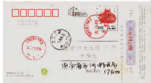
图5 海南西南中沙群岛邮戳明信片