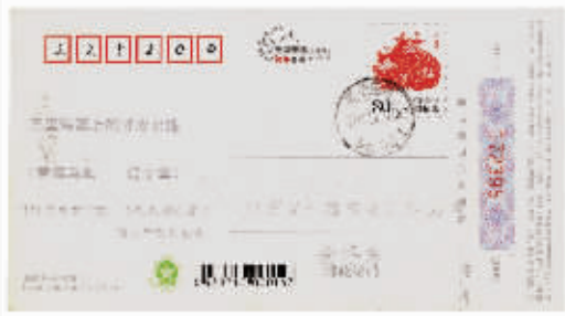
图2 辽宁庄河石城岛邮戳明信片

门买了一台平推式打印机,把邮编、地址、姓名全部打印在明信片上,在空白处还要打上“万里海疆上的璀璨明珠”这个藏品主题。对有的岛屿我专门打上了相关说明,例如在岱山这枚明信片(图1)上,我打印了“岱山又叫东海蓬莱,位于舟山群岛中部,是舟山第二大岛,海水、沙滩、礁石、海鲜、渔火是岱山的特色”;有的岛屿曾经有名人题诗,例如在石城岛这枚明信片(图2)上,我打印了郭沫若