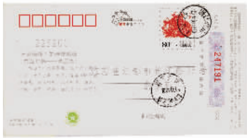
图1 浙江岱山岛邮戳明信片