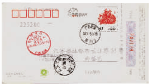
图3 广西北海涠洲岛邮戳明信片