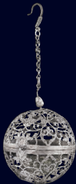
唐银镂空鸚鵡纹香囊(估价10万-15万),直径5厘米,重46克