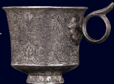
唐银鍍刻卷草纹杯(估价5万-7万),高4.5厘米,重53.3克