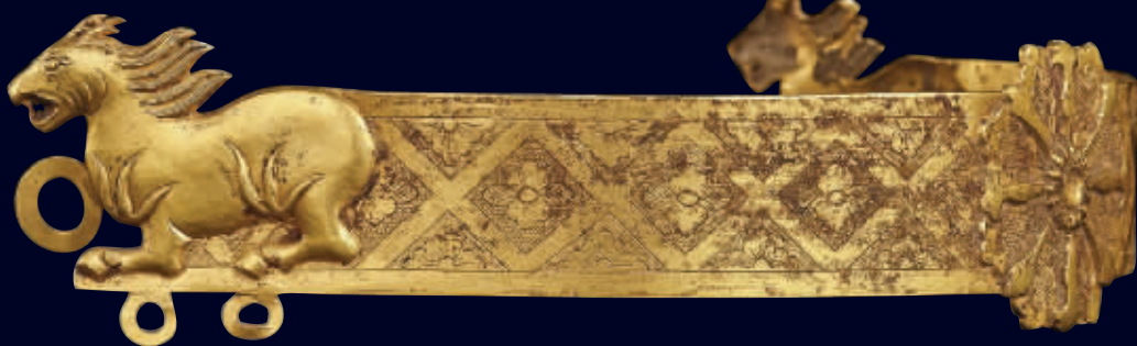
七一九世纪金锤鏢马纹冠饰(估价6万-8万),长31厘米,重107.3克