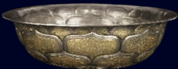
唐银局部鎏金花鸟纹莲瓣式碗(估价200万-300万),直径24.5厘米,重1052克