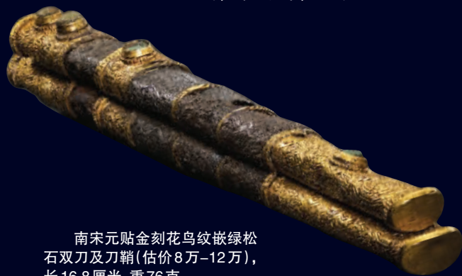
南宋元贴金刻花鸟纹嵌绿松石双刀及刀鞘(估价8万-12万),长16.8厘米,重76克