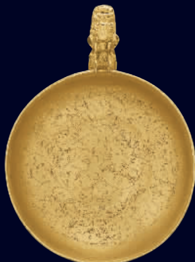
元金刻缠枝牡丹纹龙首柄杯(估价60万-80万),宽11.2厘米,重72.1克