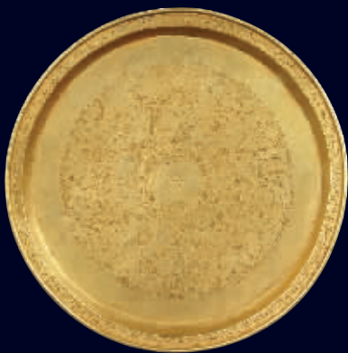
元金刻牡丹纹盘(估价20万-30万),直径15.6厘米,重121.1克