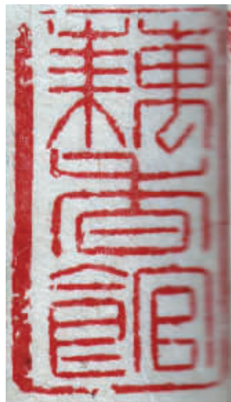
章石承用印:藕香馆