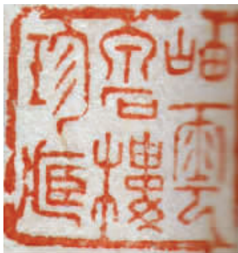
章石承用印:岫云泉石楼珍藏

指引,记娓娓长谈,夜深更深灯晕。一代词宗,千秋师表,口碑公认。迢迢西山那处?北望紫方寸。知何时展蓬,热泪今朝痛拭。