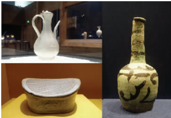
“南海1号”沉船出水德化窑青白釉印牡丹纹六棱带盖执壶(左上)、定窑白釉刻花水纹枕(左下)和磁灶窑绿釉褐彩长颈瓶(右)