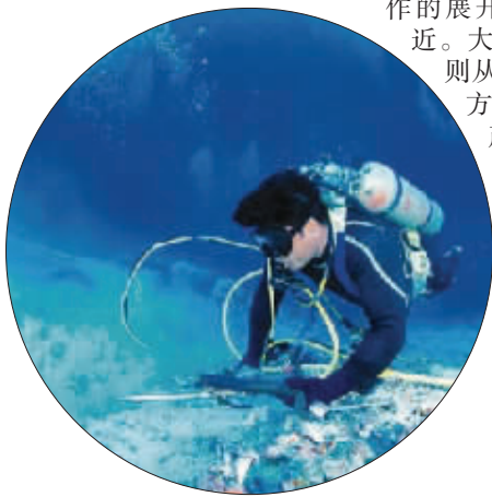
台湾考古潜水人员探测沉船基地

两岸水下文化遗产保护工作的展开相较于海外都属晚近。大陆始自1987年,台湾则从1995年萌芽。如今,方兴未艾的水下文化遗产保护工作,被两岸专家学者公认为最具潜力的范围,合作面