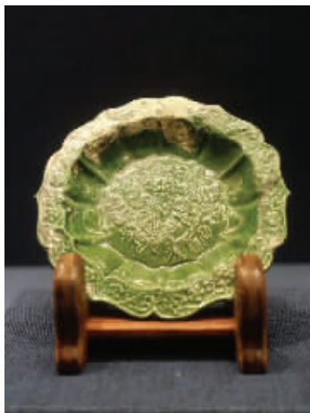
“南海1号”沉船出水磁灶窑绿釉印花卉纹折沿菱口碟