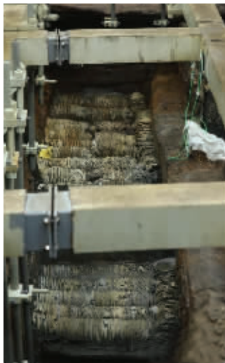
“南海1号”船体内的文物