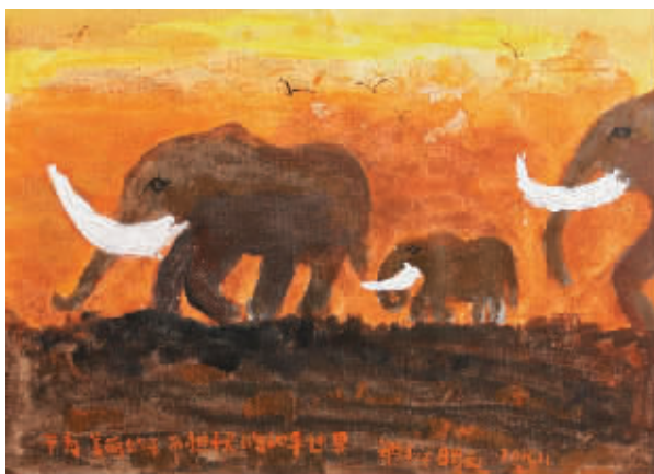
北京郑钰洋《不为美丽的牙而担忧的和平世界》

据悉,本届展览由中国宋庆龄基金会、中华文创发展协会、厦门市文化交流协会、云扬天际文化艺术机构联合主办,台湾艺术教育馆、顶新公益基金会、厦门市海沧区文学艺术界联合会协办。(柴逸扉 孙立极)