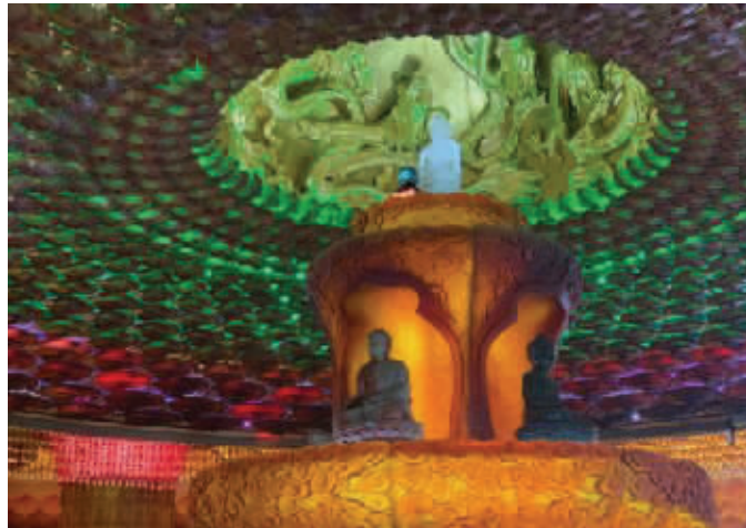
夜明珠安置于天宁宝塔水晶佛前