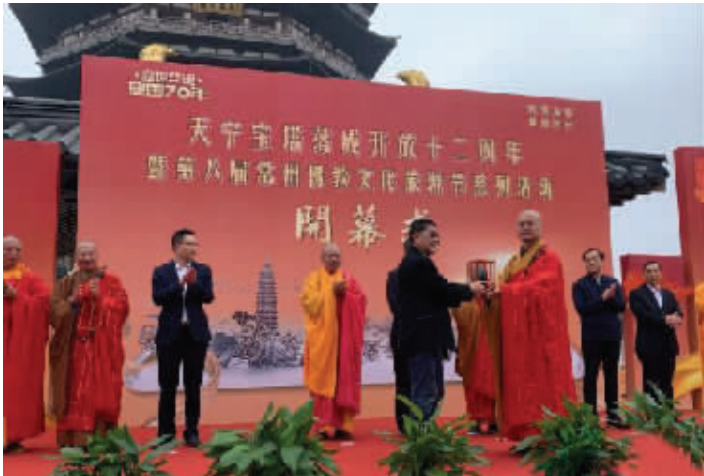
江苏常州天宁寺举行夜明珠捐赠仪式暨第八届常州佛教文化旅游节开幕式

当日捐赠仪式后,夜明珠被安放在天宁宝塔十三层的蓝毗尼水晶大佛前,游客可登塔参观。(李哈雪)