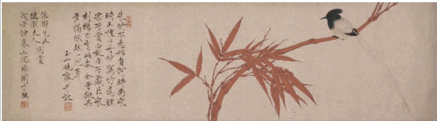
图1 于非闇《朱竹图卷》