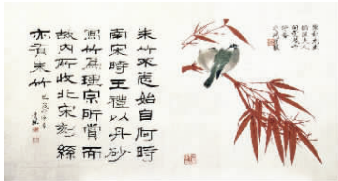
图2 于非闇《朱竹翠鸟》