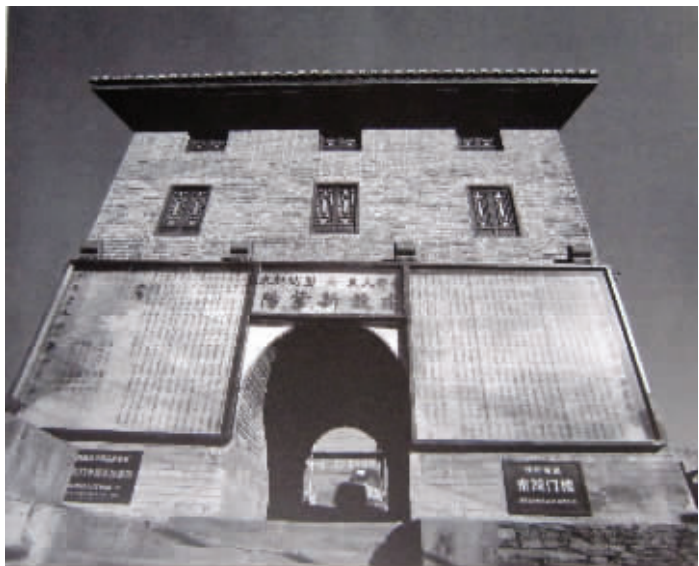
图1-1 紫阳县东城门墙壁上的“快板布告”