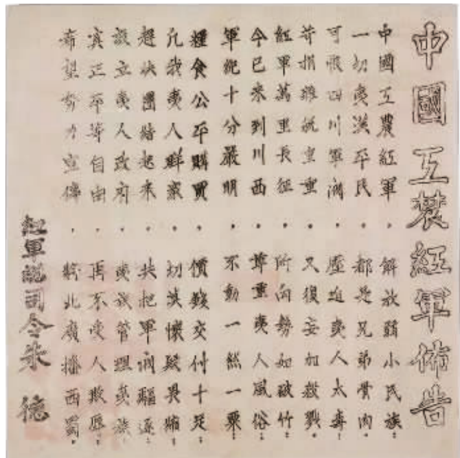
图3 朱德签署六言二十六句《中国工农红军布告》

紫阳县东城门《布告》,篇幅之大,全国独创。我党我军的光辉思想,必将照耀紫阳人子子孙孙,永远受益。