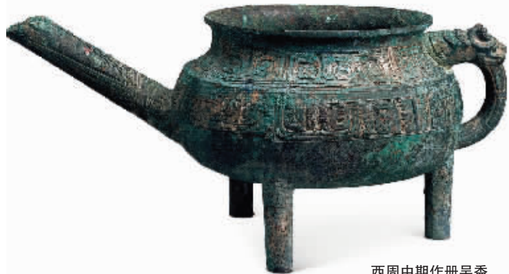
西周中期作册吴盃