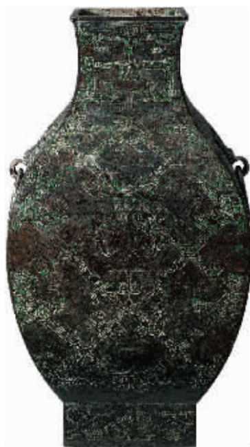
战国嵌孔雀石几何勾连云纹纺