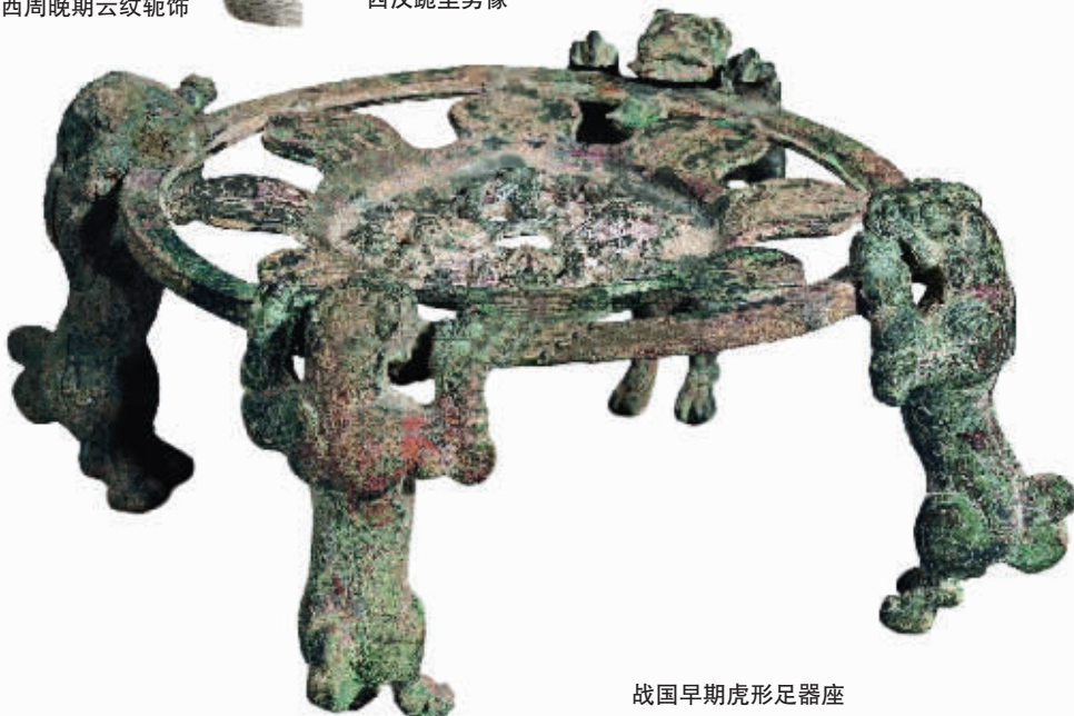
战国早期虎形足器座