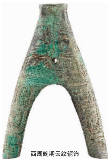
西周晚期云纹鞞饰