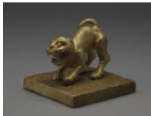
追缴文物“明崇祯十六年虎钮‘永昌大元帅’金印”