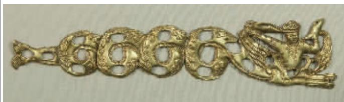
追缴文物“唐吐蕃人身鱼尾形金饰片”

为全面总结和展现打击防范文物犯罪成果,彰显党和政府打击文物犯罪、保护文化遗产的决心与意志,震慑文物犯罪,提高全社会文物保护意识,公安部、最高人民法院、最高人民检察院、国家文物局近日在中国国家博物馆联合推出“众志成城 守护文明——全国打击防范文物犯罪成果展”。