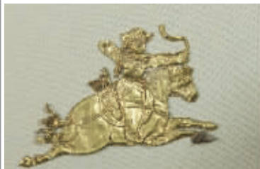
追缴文物“唐吐蕃骑射形金饰片”