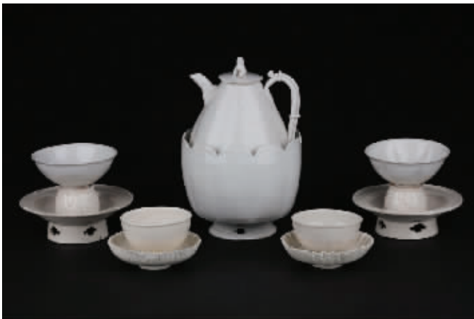
追缴文物“宋代白釉带温碗酒注、带托盏、花口盏盘”

据介绍,2013年以来,全国公安机关累计侦破各类文物犯罪案件5000余起,抓获犯罪嫌疑人1万余名,追缴文物数以万计。(翟群 杜洁芳)