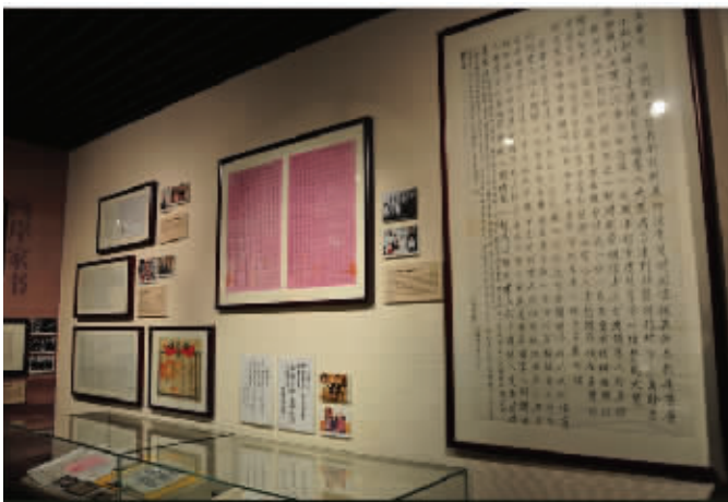
1996年整张宣纸写就的两岸家书,中国人民大学博物馆藏