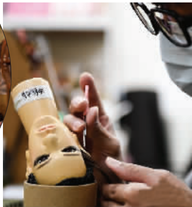
工作人员在台湾云林的影棚操纵霹雳布袋戏人偶