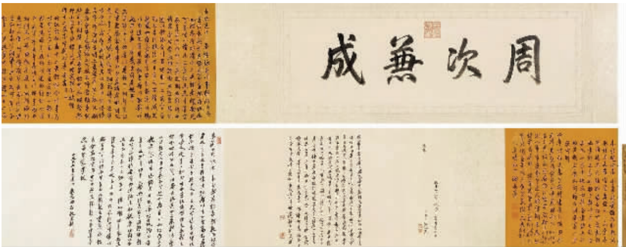
行书御制诗并序手卷,成交价2530万元