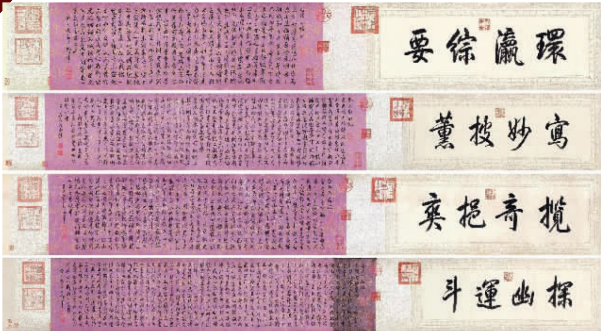
御笔《白塔山记》手卷,成交价1.1615亿元