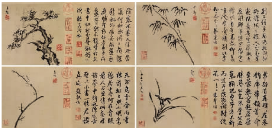
书画合璧四友图册页(八开),成交价1725万元