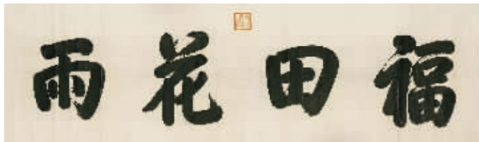
御笔“福田花雨”,成交价805万元